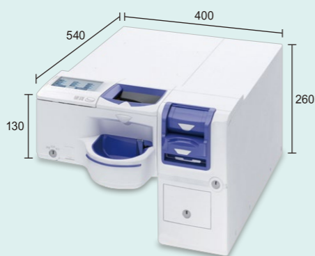
横型(紙幣投入口) など