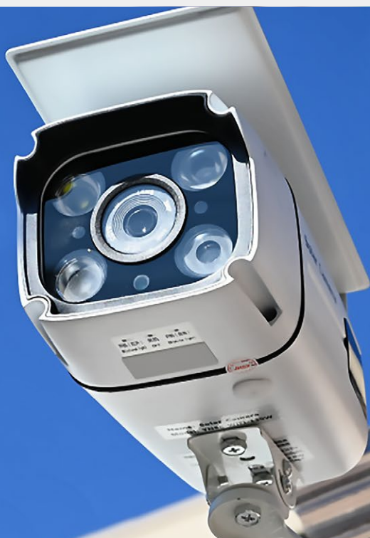
ソーラー搭載カメラ